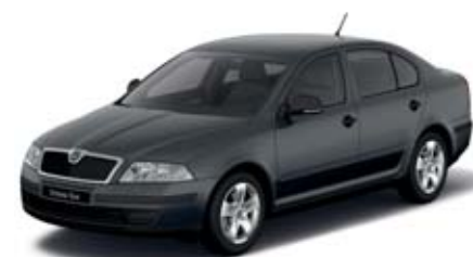
Šedá Anthracite metaliza