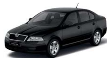
Černá Magic s perleťovým efektem