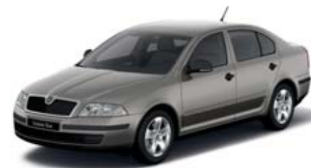
Běžová Cappuccino metaliza