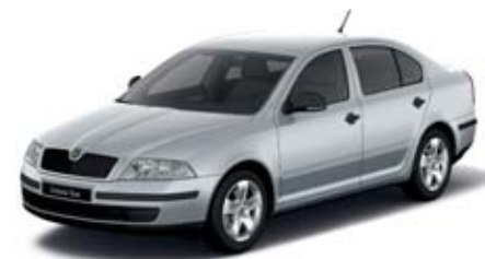
Stříbrná Brilliant metaliza