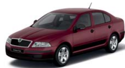
Rosso Brunello metaliza