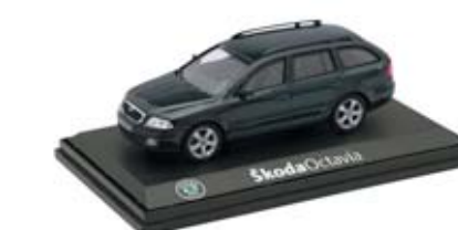
Model vozu Škoda Octavia Combi Tour ve velikosti 1 : 43