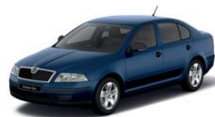
Modrá Storm metaliza