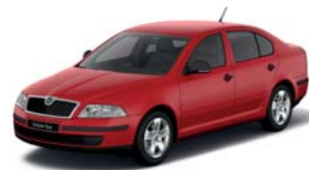
Červená Corrida uni