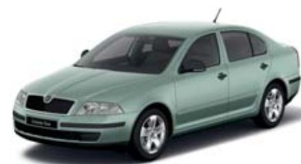
Zelená Arctic metaliza