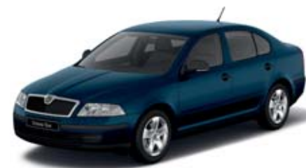
Modrá Pacific uni