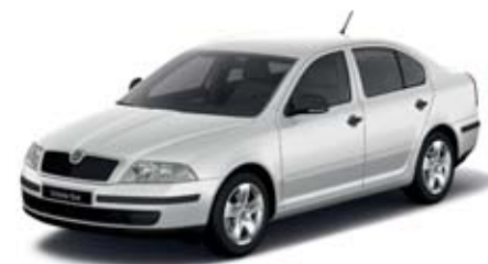
Bílá Candy uni