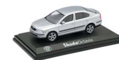
Model vozu Škoda Octavia Tour ve velikosti 1 : 43