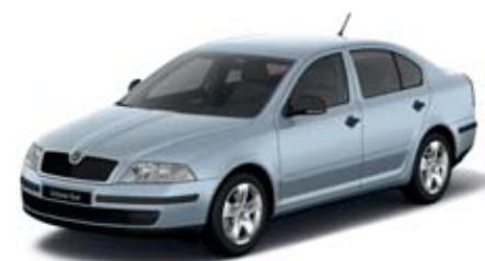
Modrá Aqua metaliza