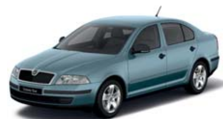
Šedá Satin metaliza