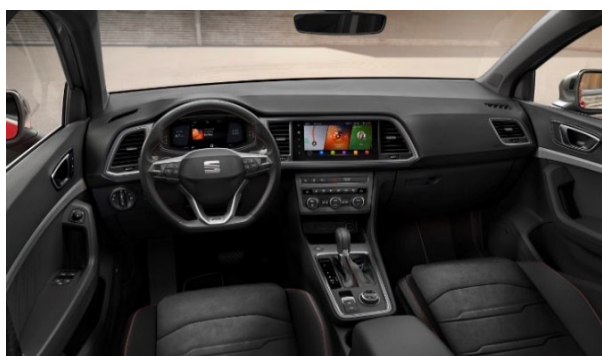
Digitální přístrojový štít s 10,25" barevným TFT displejem

Bezdotykové elektrické ovládání 5. dveří + Alarm