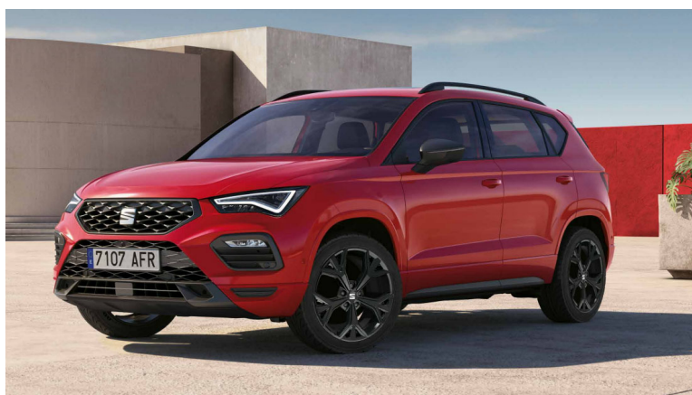
19" lesklá černá kola z lehkých slitin Exclusive IV